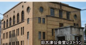
旧大津公会堂レストラン