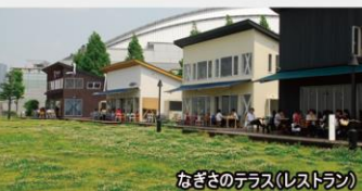
なぎさのテラス(レストラン)