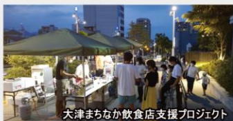
大津まちなか飲食店支援プロジェクト

中心市街地の飲食店を支援するための「大津まちなか飲食店支援プロジェクト」の事務局を務めています。今回はびわ湖大津観光協会主催の「びわ湖大津春のライトアップ 桜の琵琶湖疏水」にあわせて、「ワンドリンク無料キャンペーン」を実施します。